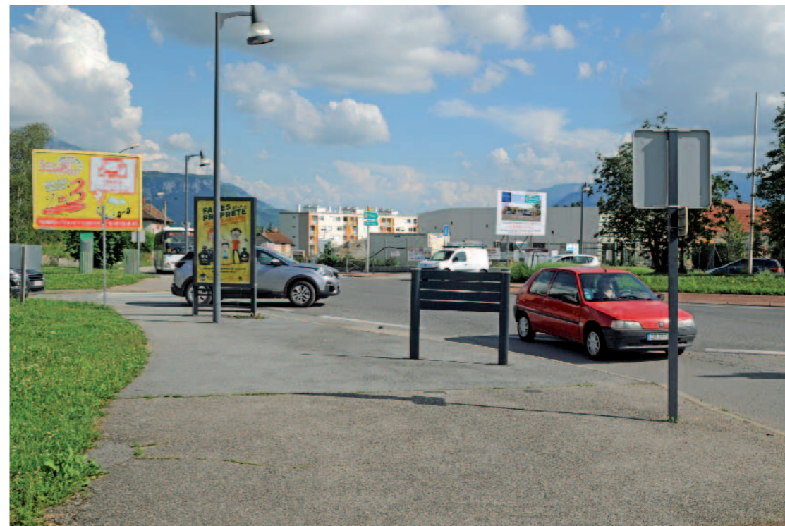
ROND-POINT DES BLANCHISSERIES, Depuis avenue du 8 mai 1945 Voiron