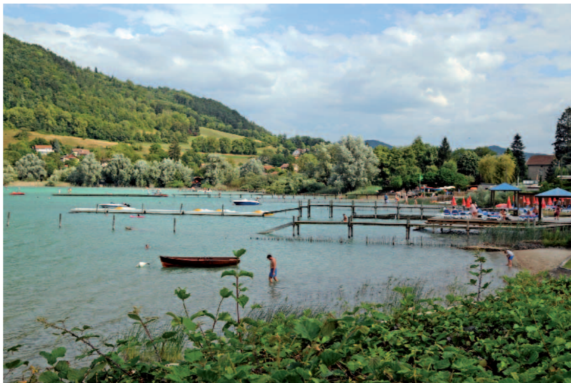
RIVES SUD LAC DE PALADRU Depuis Rue Principale, Charavines