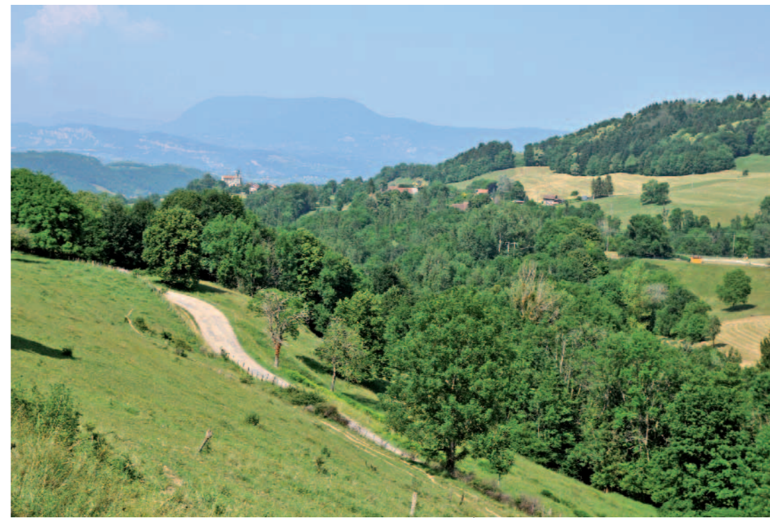
VAL D'AINAN Depuis route du Col des Mille Martyrs (D28), Le Burlet, Merlas