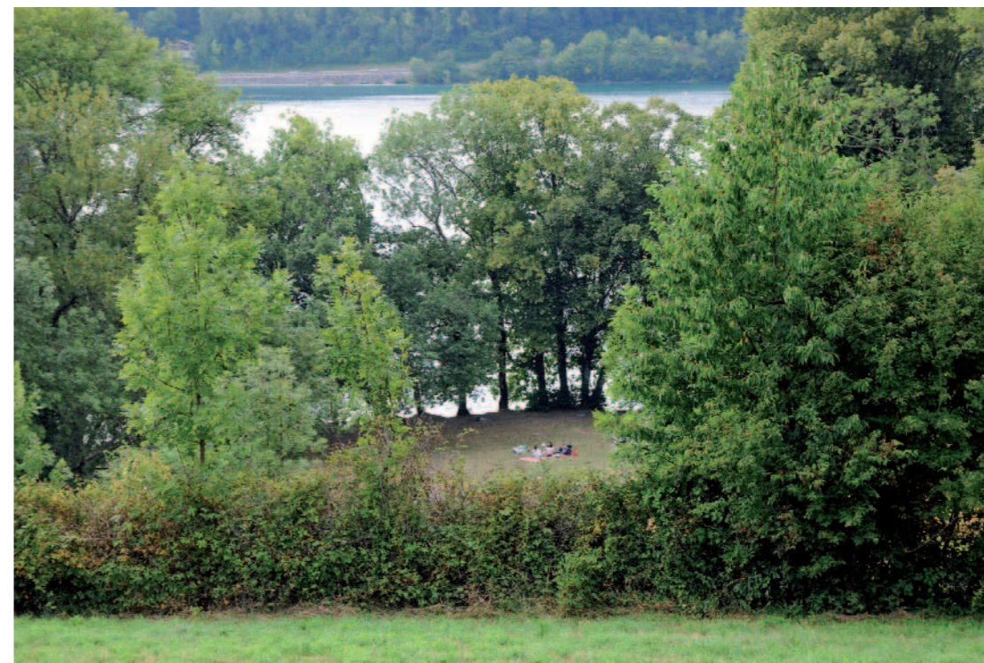
RIVES DU LAC DE PALADRU Depuis route du Bord du Lac, Bilieu