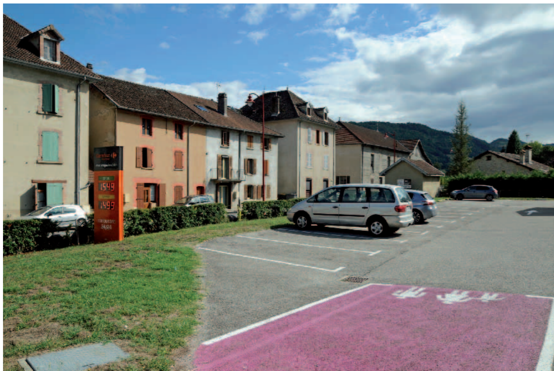
HAMEAU DE LA MARTINETTE Depuis zone industrielle de La Tuery, Saint-Geoire en Valdaine