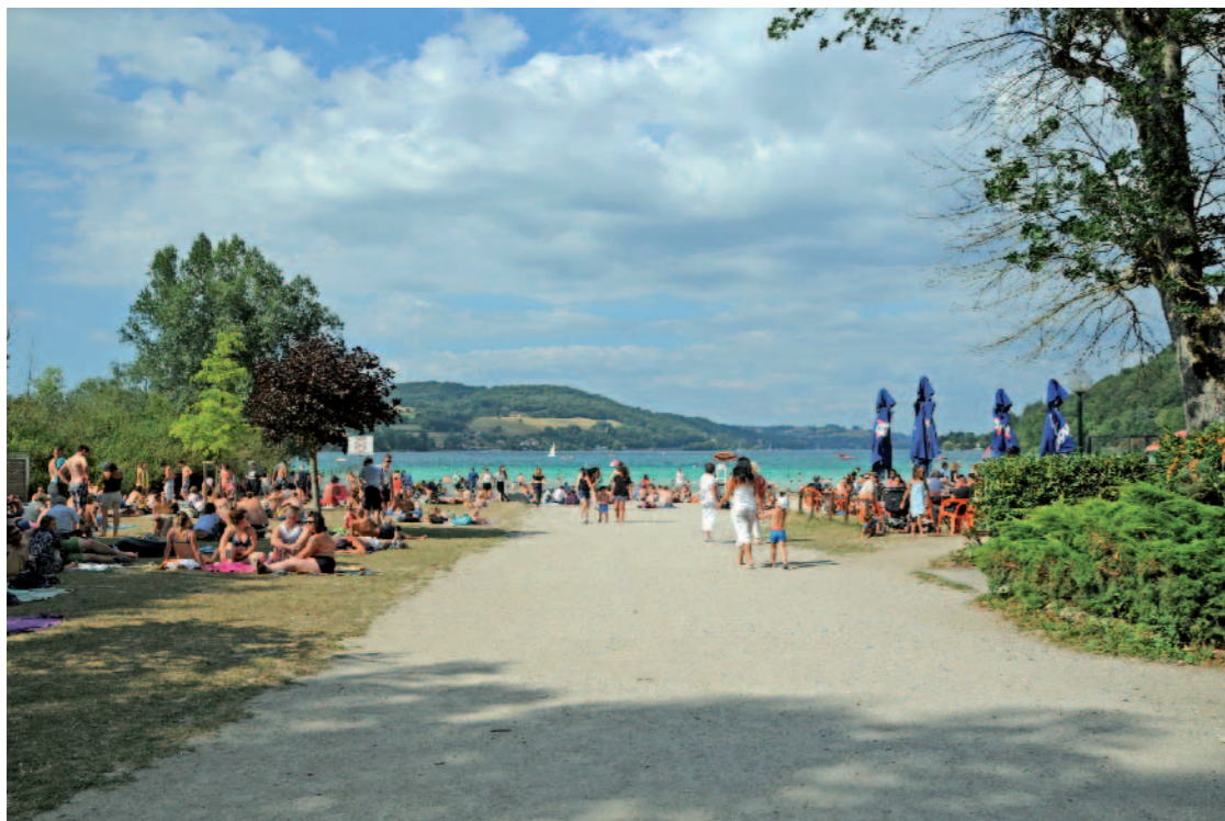
LAC DE PALADRU Depuis Plage Municipale, Charavines