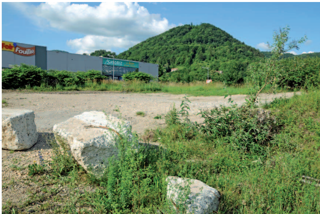
BLANCHISSERIES Depuis avenue du 8 mai 1945, Voiron