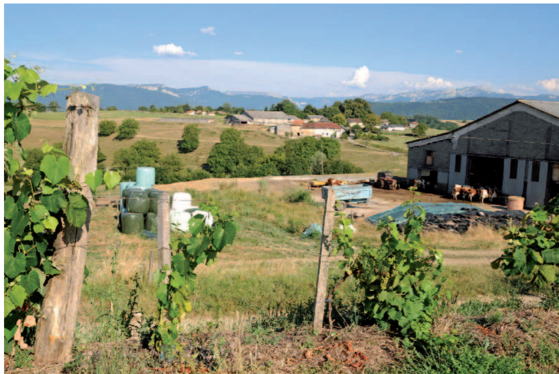
VAL D'AINAN Depuis route de la Bâtie, Côte d'Alagnier, Velanne