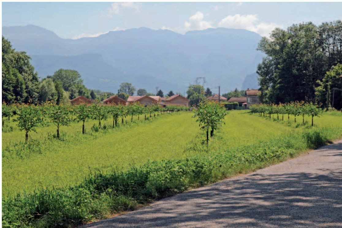
PLAINE DE L'ISÈRE Depuis chemin Saint-Jean-de-Chépy vers Massif du Vercos, Tullins