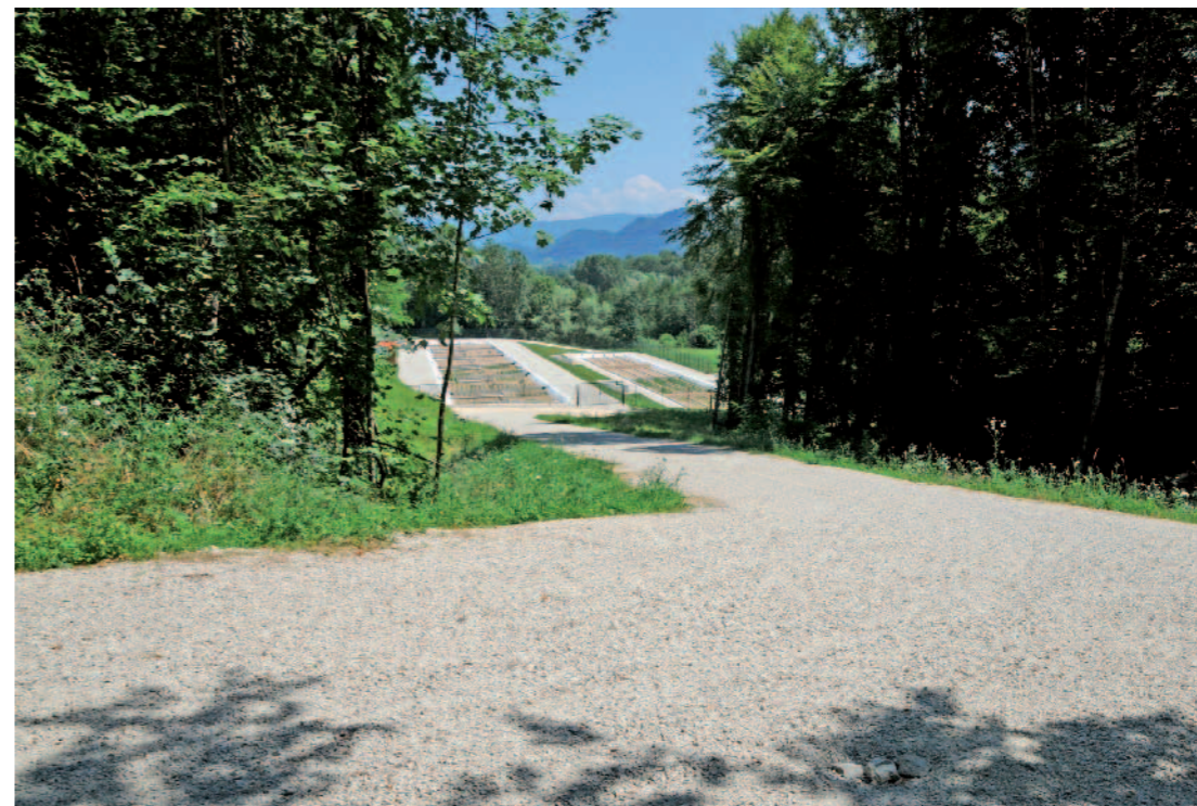
USINE DE FILTRATION Depuis chemin du Val d'Ainan, Saint-Bueil