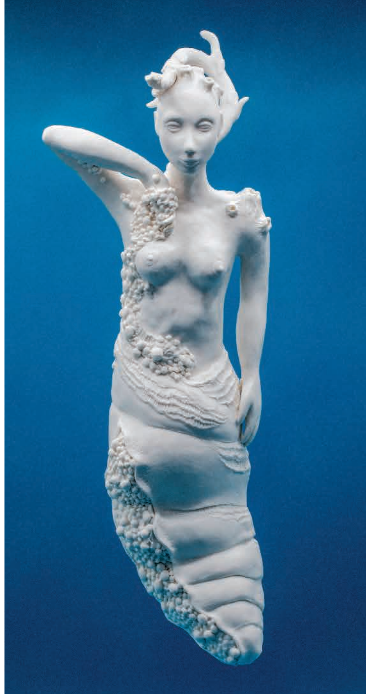
N. Charrié & A. Cassel - La chrysalide - Installation Cosmogonie

COMMISSAIRE DE L'EXPOSITION : NATHALIE AGERON