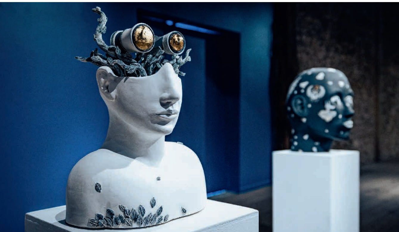
A. Cassel Fragments mythologiques