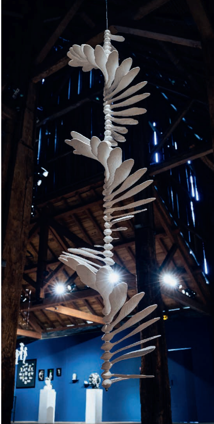
N. Charrié - La mécanique de la chute