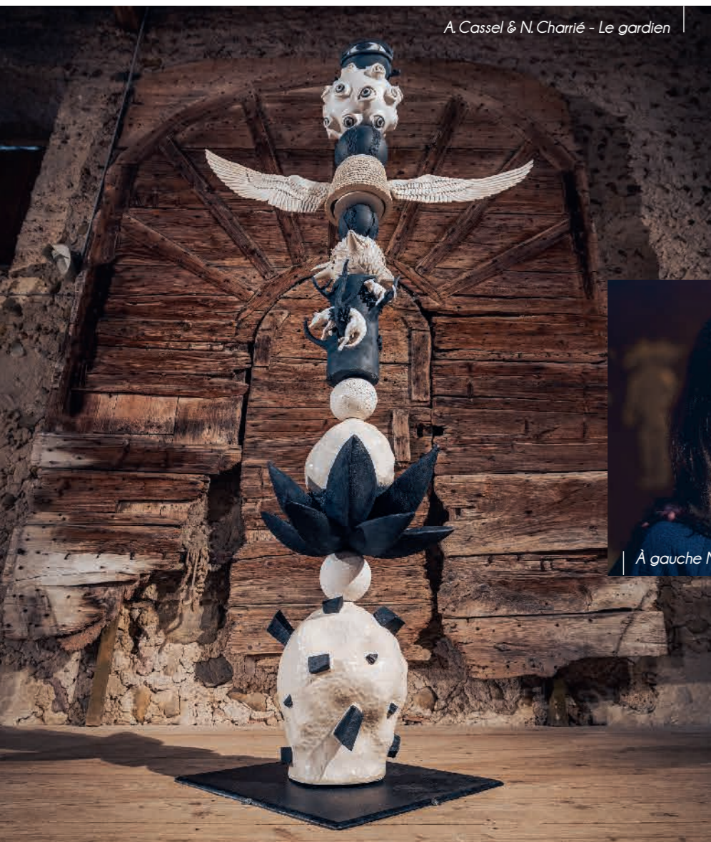
A. Cassel & N. Charrié - Le gardien

Une collaboration qui a vite emprunté les chemins mystérieux des métamorphoses du vivant, où se croisent les références des deux céramistes. Ainsi est née Cosmogonie, installation de 14 figures de porcelaine suspendues en cercle. Beaucoup de blanc, pour laisser la lumière jouer sur ces corps hybrides et en dévoiler imparfaitement les énigmes, afin que chacun puisse y projeter ses propres interrogations. Une introduction sur la création d'un nouveau monde, peut-être celui de demain, qui nous laisse entrevoir la fragilité du vivant.