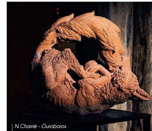
N. Charrié - Ouroboros

www.nathalie-charrie.fr - @charrie_ceramic_artist