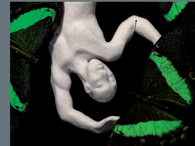
N. Charrié - Icare