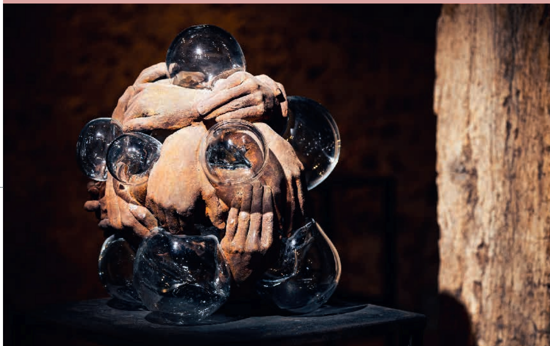
N. Charrié Supernova