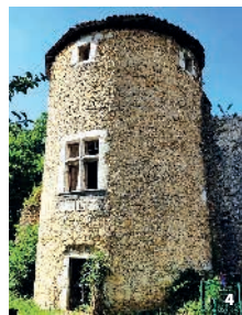
4. Vestiges du château de Tullins, Tullins