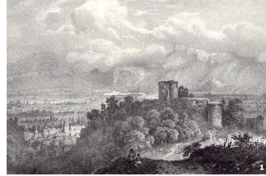
1. Plaine de Tullins, Victor Cassien, 19 e siècle Tullins